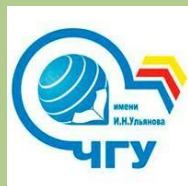
Чувашский ГУ им. И.Н. Ульянова