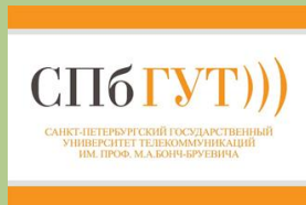
СПбГУТ им. Бонч-Бруевича